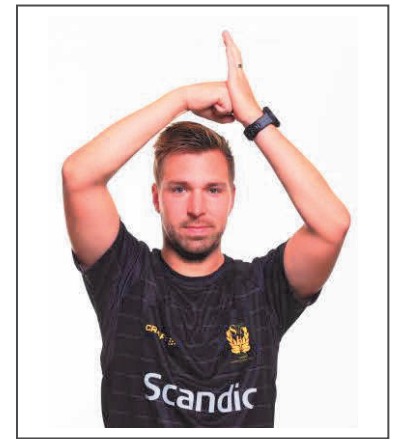
6. Offensivt fel