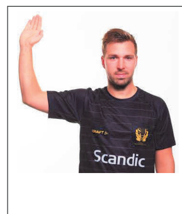
17. Förvarningstecken för passivt spel