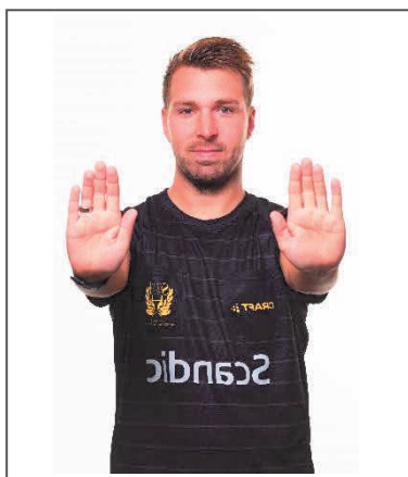
10. Håll 3-meters avstånd