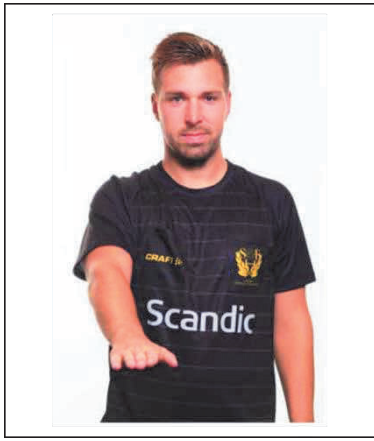
1. Beträdande av målgården