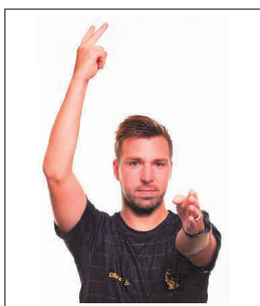
14. Utvisning (2 minuter)