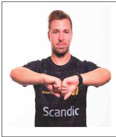
4. Omklamring, fasthållning eller knuff