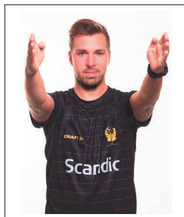
7. Inkast – riktning