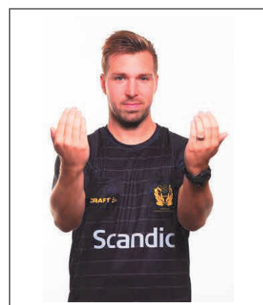
16. Tillåtelse för två personer (som är deltagarberättigade) att beträda spelplanen under timeout