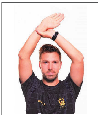
11. Passivt spel