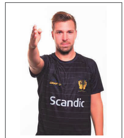
9. Frikast - riktning