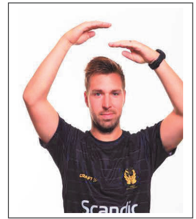
3. För många steg eller bollen hålls mer än tre (3) sekunder