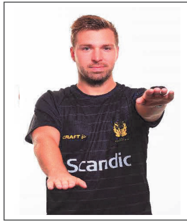
2. Felaktig dribbling