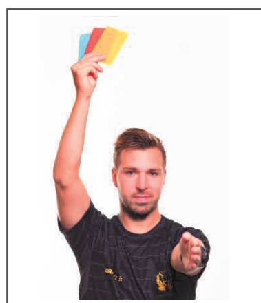
13. Varning (gult kort), diskvalifikation (rött kort) Information om rapport (blått kort)